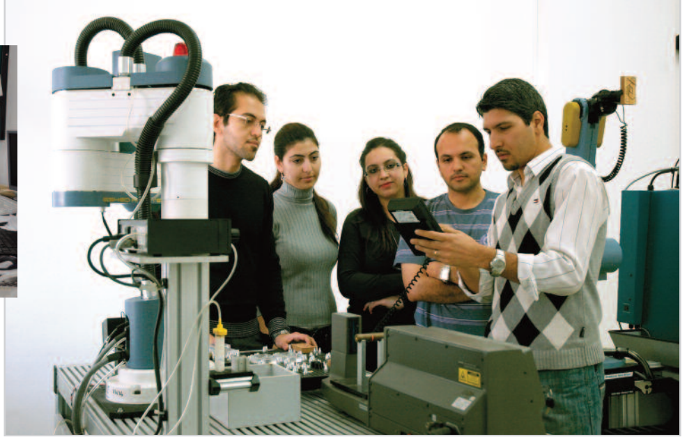
Mühendislik Fakültesi öğrencileri çift anadal yapma hakkına sahip oldular.