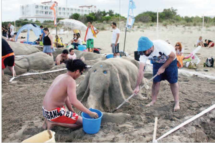
Kumdan Heykel Festivali ve Yarışması.