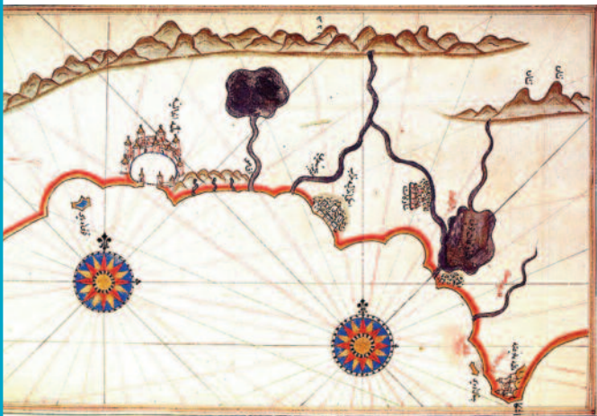
Piri Reis haritalarından biri.

Doğu Akdeniz Üniversitesi Sualtı Görüntüleme ve Araştırma Merkezi (DAÜ-SAGAM) Antalya Müzesi ile birlikte Antalya-Kemer kıyıları arasında ortaçağdan kaldığı tahmin edilen savaş gemisi batığının kazı-