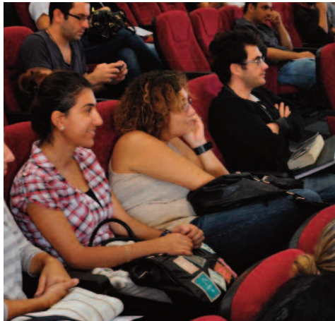
Öğrenciler Konferansı keyifle dinlediler.