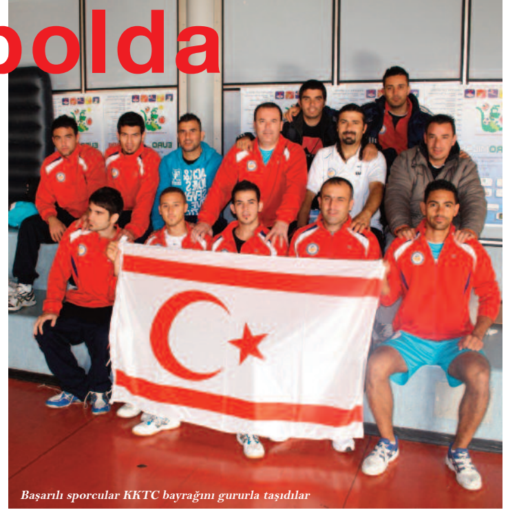
Başarılı sporcular KKTC bayrağını gururla taşıdılar

Gerek turnuva boyunca samimi ve aynı zamanda disiplinli hareketleri, gerekse sportif anlamda oynadıkları oyun ve gösterdikleri performans ile haklı bir destek ve beğeni toplayan takımımız 19 Kasım akşamı çıkmış olduğu final maçında grubunda ilk maçta karşılaştığı Çek Cumhuriyeti temsilcisi ile girdiği mücadelede son ana kadar denk ve başarılı bir