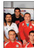
DAÜ Voleybolda Avrupa'yı Titretti