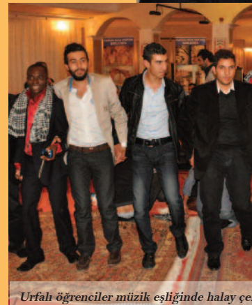
Urfalı öğrenciler müzik eşliğinde halay çektirdi