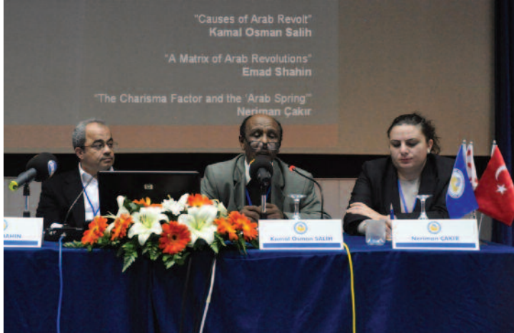
Farklı ülkelerden birçok katılımcı Arap ayaklanmasını tartıştı.

Bakan Atun: "KKTC Ahlak Dışı ve Yasa Dışı İzolasyonlara Maruz Kalmaktadır"