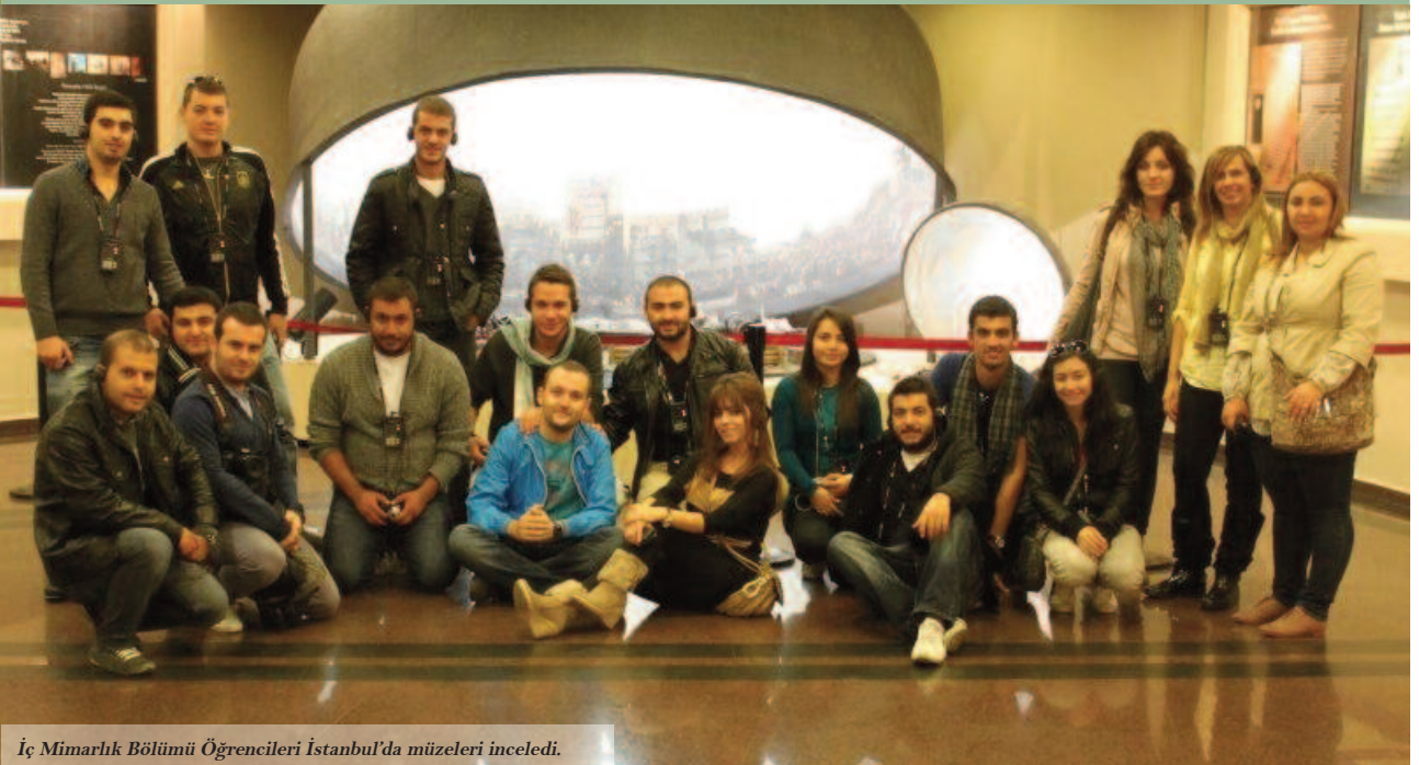
İç Mimarlık Bölümü Öğrencileri İstanbul'da müzeleri inceledi.