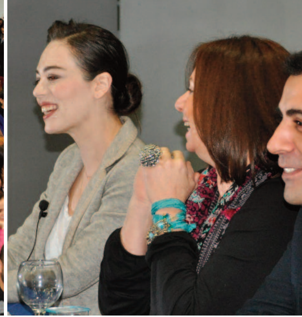
Söyleşi çok yoğun katılıma sahne oldu.