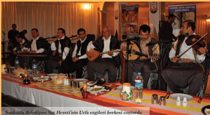
Şanlıurfa Belediyesi Saz Heyeti’nin Urfa ezgileri herkesi coşturdu