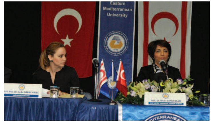
Kadına Yönelik Şiddet Aktivite Salonu'nda ele alındı.