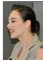
"1 Kadın 1 Erkek" DAÜ'den Geçti