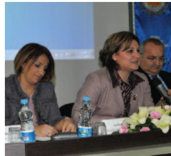
Konferansta Sağlık Bilimleri Fakülteleri tartışıldı