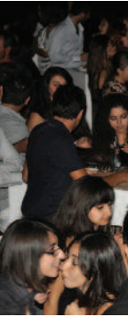
Sağlık Bilimleri Fakültesi

çekiciydi. Sürpriz müzik ve eğlence terileri ve sahilde faaliyetler damgası Sağlık Bilimleri Fakültesi öğrencileri öğlelikte keyifli bir ş yeni akade