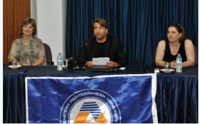
DAÜ-KPM tarafından düzenlenen konferans

"Günümüzde kaçımız ülkelerimizdeki yargı sürecinin etkinliği ve yapısından yeterince memnunuz?" sorusunu konuklara yönelterek konuşmasına başlayan Uluslararası Sınırlar Ötesi Arabulucular Örgütü başkanı Lynn Cole, pahalı ve yavaş ilerleyen teknik yargı sistemlerine etkili bir alternatif olan uluslararası profesyonel arabuluculuğun hızlı sonuç alınan verimli bir