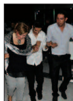
Sağlık Bilimleri Fakültesi Yeni Akademik Yıla Hoşgelden Partisi Vererek Başladı