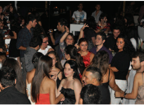
öğrencilerin yeni öğrencileri coşkulu bir gece yaşadı

etkinliklerle öğrencilerin bir araya gelip sosyal bir ortamı paylaş- masının gelecekteki meslek hayat- larındaki disiplinler arası ekip çalışmasına zemin hazırladığını ve mesleklerini eğlenerek öğrendik- lerini belirtti. Bu tarz sosyal etkin- liklerin yıl içerisinde periyodik