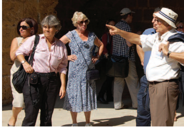
Konferans katılımcıları suriçinde incelemede bulundu

Nostra Bilim Komitesi üyeleri, Kültür Varlıkları Teknik Komitesi üyelerinin de katılımı ile öğleden önce Gazimağusa Suriçi'nde incelemelerde bulundu.