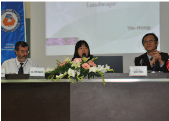
Konferanslar oldukça ilgi çekiciydi

Öğle arasından sonra geçilen oturumdaki sunumlar şu şekilde gerçekleştirildi: