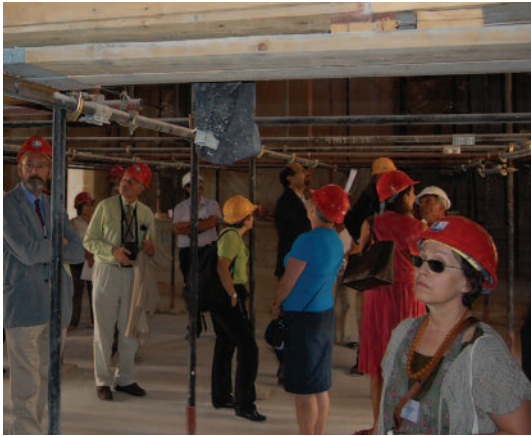
Yabancı katılımcılar koruma ve iyileştirme konusunda inceleme yaptılar.

Europa Nostra Bilim Komitesi'nin Kıbrıs'ta ilk kez, "Conservation and Enhancement in Former Conflict Zones – Eski Çatışma Bölgelerinde Koruma ve İyileştirme" teması çerçevesinde gerçekleştirdiği 47. konferansı, Gazimağusa Suriçi'nde bulunan Doğu Akdeniz Üniversitesi (DAÜ) Kültür Merkezi'nde gerçekleştirilen oturumlarla başarı ile tamamlandı. DAÜ'nün büyük bir destek verdiği konferansın Gazimağusa'da gerçekleştirilen bölümünde, İtalya, İrlanda, İngiltere, Çek Cumhuriyeti, Fransa, KKTC ve Güney Kıbrıs'tan Europa