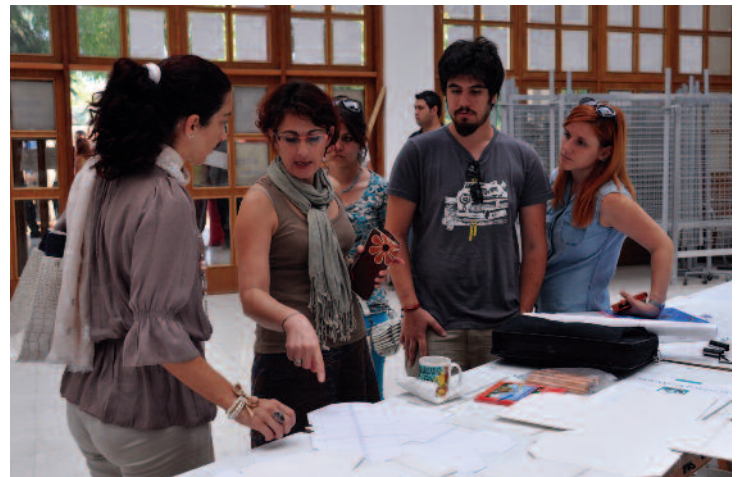
Mimarlık Öğrencileri Kağan Güner'in çalışmalarını incelediler.

Kağan Güner aynı zamanda UNICEF, UNESCO ve Pasifik Kültür Merkezi Ulusal sanatçısı olarak onurlandırılmıştı. Kendisi 20 sene Londra'da yaşadığından sonra Gazimağusa, DAÜ ailesine katıldı.