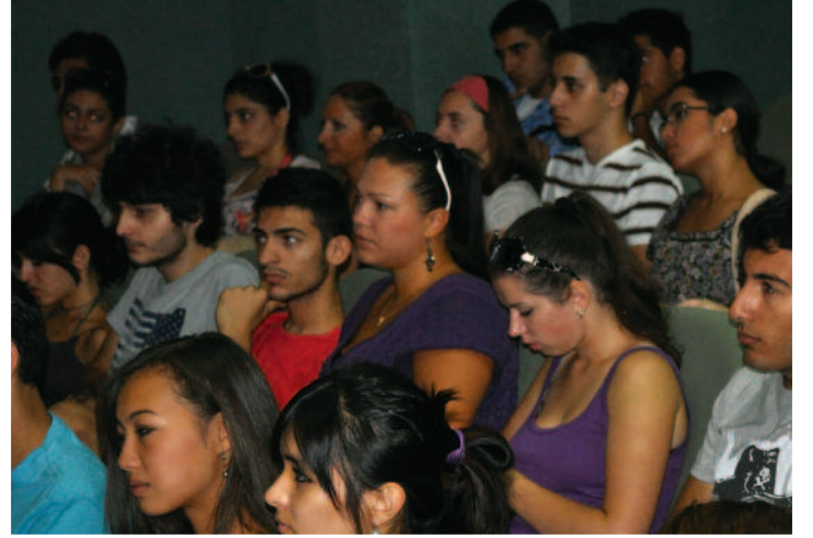
Hazırlık öğrencileri etkinliği ilgiyle izledi

Öğrenciler, dönem boyunca yapacakları çalış-