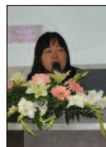
Çin-Kıbrıs Türk Medyası İrdelendi