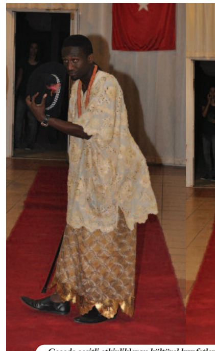
Gecede çeşitli etkinlikler ve kültürel kıyafetler