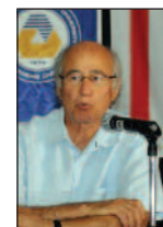
Mimarlık Fakültesi Dünya Mimarlık Günü'nü Kutladı