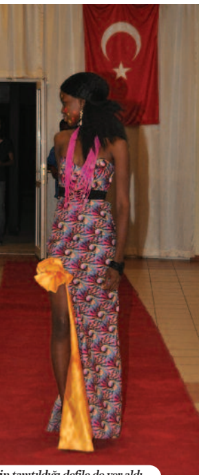
in tanıtıldığı defile de yer aldı.