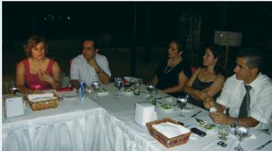
DAÜ Yönetimi Özel Hastaneler Birliği Yönetim Kurulu Üyeleri ile İşbirliği konularını görüştü