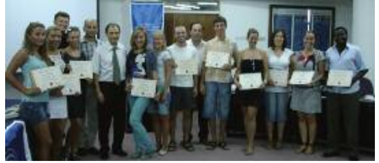
Sertifika alan öğrenciler birarada

Ukrayna ile DAÜ arasında imzalanan işbirliği anlaşması çerçevesinde öğrenci değişim programı oluşturulmuştur. Bu çerçevede ilk adım olarak bu yaz bir grup Ukrayna Bankacılık Akademi öğrencisi DAÜ İşletme ve Ekonomi Fakültesi, Bankacılık ve Finans Bölümü'nde gerçekleştirilen yatırım projeleri değerlendirme ve yönetimi konulu derslere katılarak programı tamamlamışlardır. Program çerçevesinde dersler özellikle Bankacılık ve Finans Bölümü'nün gerek lisans gerekse yüksek lisans master seviyesinde oluşturduğu yatırım projeleri değerlendirme konularındaki uzman kadrosuyla gerçekleştirilmiştir. Öğrenci değişim programı çer-