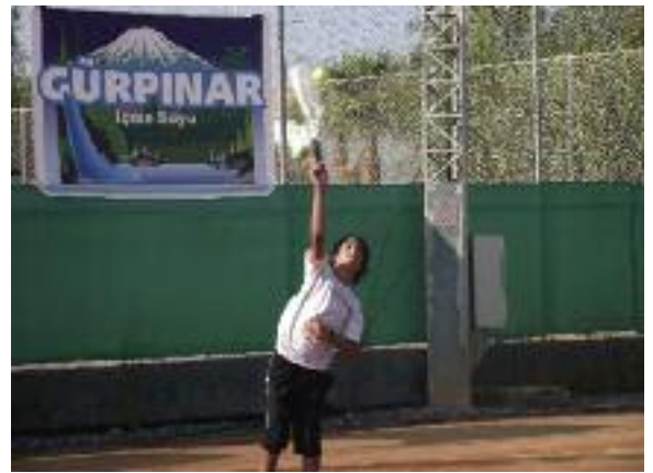
Turnuva çekışmeli maçlara sahne oldu

Rusya'dan Adler Tenis Akademisi, Türkiye'den Trabzon Tenis Kulübü, Antalya Tenis İhtisas Kulübü, Gökhan Dönmez Tenis Akademisi, KKTC'den Doğu Akdeniz Üniversitesi Tenis Kulübü, Gazimağusa