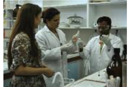
Kimya Bölümü laboratuvarlarında çalışma yapılıyor.

KKTC'de organik boyar madde esaslı, şeffaf, eğilebilir özellikte ve ekonomik üstünlükleri olan Organik güneş pillerinin üretiminde ve maksimum verim koşullarının sağlanmasında katkılar sağlayacağını belirtti.