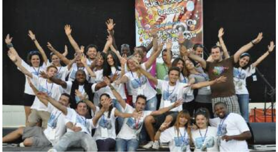
"Hoşgeldiniz Partisi"ne katılan öğrenciler doyasıya eğlendi.

Gecenin en önemli amaçlarından biri eski ve yeni öğrencilerin kaynaşmasını sağlamak olarak değerlendirildi. Bu sebeple gecede "Yalnız Değilsiniz" konseptiyle eski ve yeni öğrenciler balon savaşı yaptılar. Gecenin diğer önemli bir amacı ise "Kıbrıs Kültürünü" tanıtmak olmuştur. Bunu sağlamak amacı ile Kıbrıs'a özgü yemeklerin, tatlıların, çeşitli el işlerinin sunulduğu birçok stand açılmıştır. >> sayfa 4