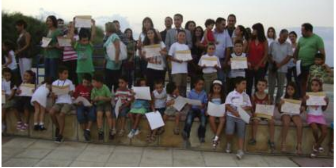
Yüzme Kursu'na katılan minikler eğitimcileri ile birarada

Törende konuşan Doğu Akdeniz Üniversitesi Tanıtım ve Gelişimden Sorumlu Rektör Yardımcısı Doç.