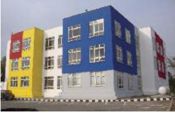
Mimarlık Fakültesi binası

Doğu Akdeniz Üniversitesi'nin en köklü fakültelerinden biri olan Mimarlık Fakültesi'nin Mimarlık Bölümü, Türkiye Mimarlık Akreditasyon Kurulu (MIAK) Akreditasyon sürecine girmiş bulunmaktadır.