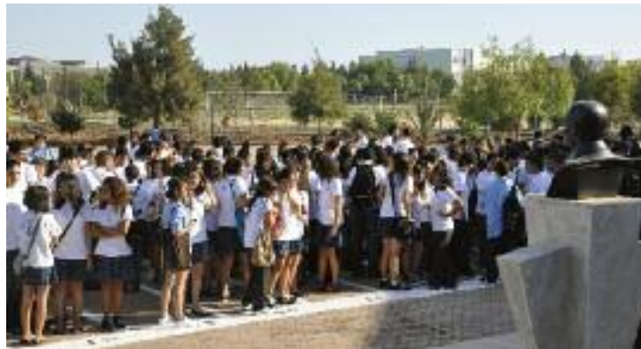
DAK'lı öğrenciler sevinç içinde yeni döneme başladılar

konuşmada 16. öğretim yılına girmenin gururunu dile getirerek DAK'ın; felsefesi, amacı, ilkeleri, kurumsal kimliği, eğitim-öğretim sistemi, fiziki ve teknolojik