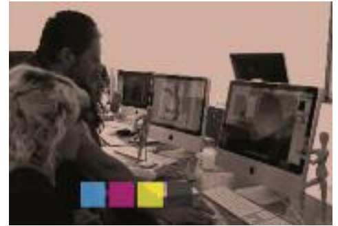
Öğrenciler son teknoloji bilgisayarlarla çalışmalarını yapıyorlar.