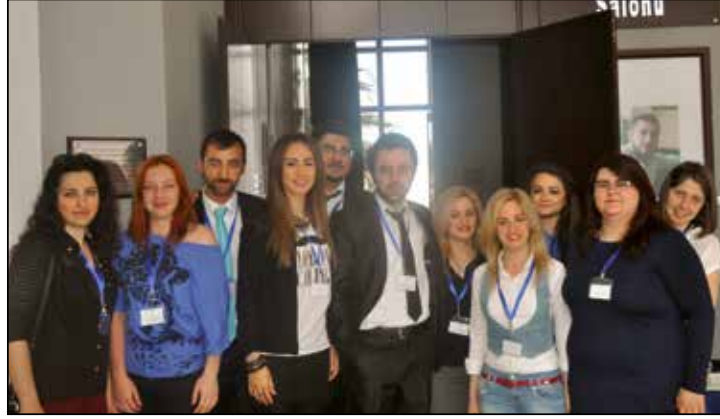
Psikoloji günleri sonrası Psikoloji Kulübü öğrencileri birarada