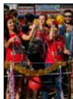
Bahar DAÜ'de Yaşandı