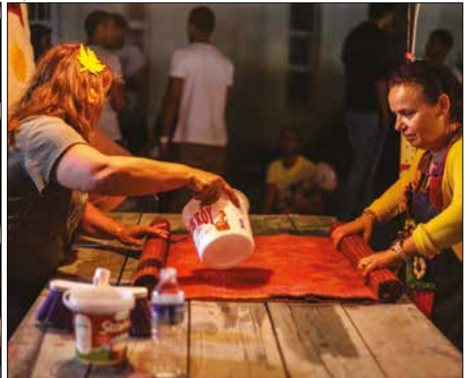
4. Sanat buluşmasında, pike yapımı çalışması