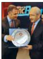
Öğrenciler Kemal Kılıçdaroğlu'nu Terletti

DAÜ çatısı altında açılacak olan yeni programlarla ilgili detaylı bilgiye ilgili akademik birimlerden, DAÜ Öğrenci İşleri Müdürlüğü'nden, DAÜ Tanıtım Ofisi'nden ve www.emu.edu.tr resmi internet sayfasından ulaşılabilir.