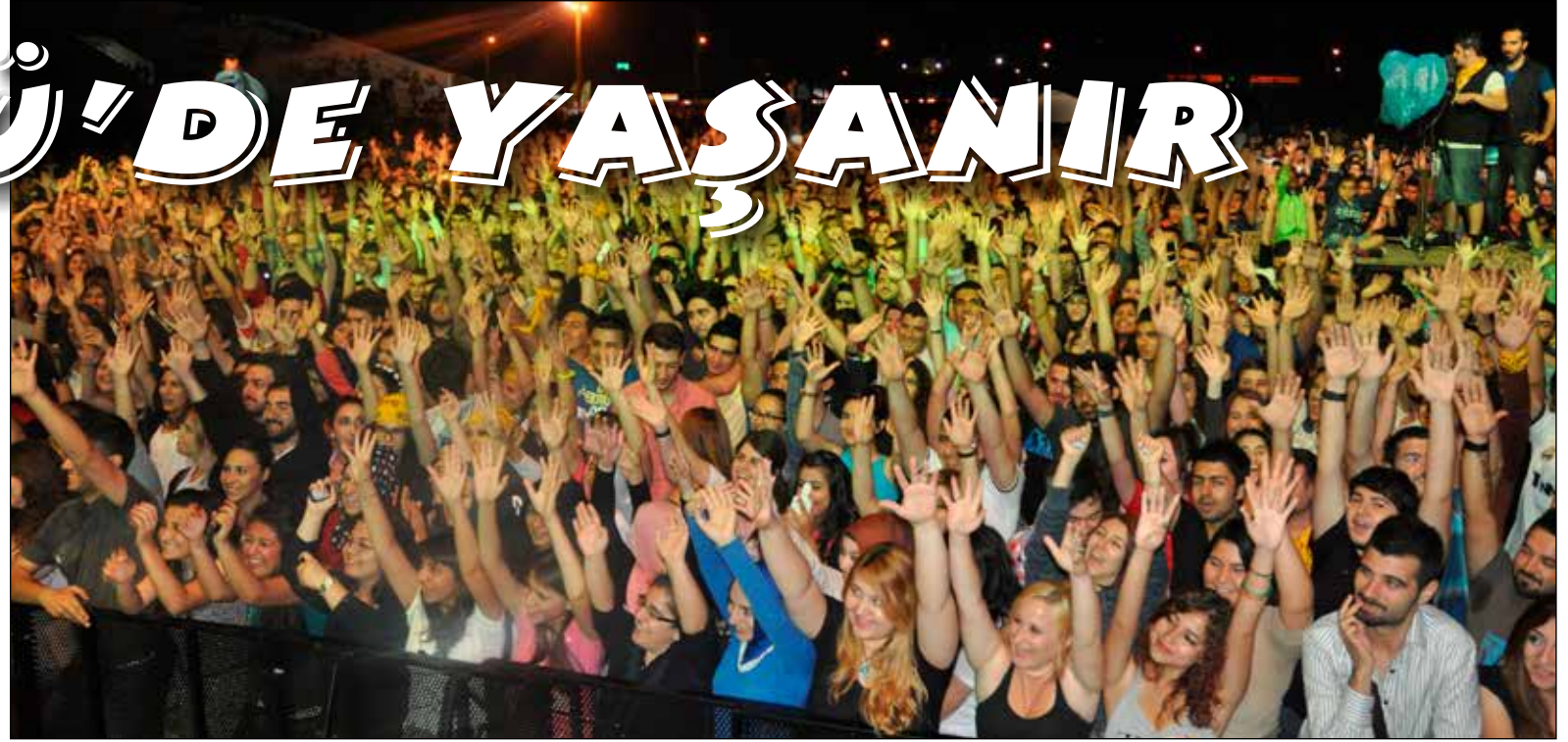
Öğrenciler konserlerle coştı