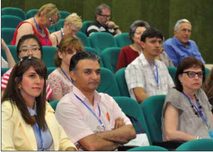
Konferansta 29 farklı ülkeden katılımcı yer aldı