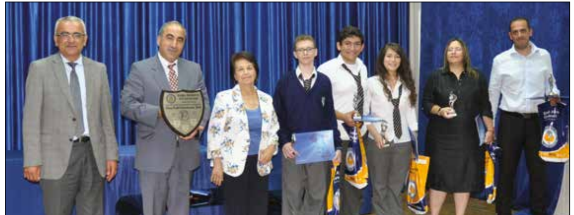
Yarışma sonrası öğrencilere ödülleri ve sertifikaları verildi