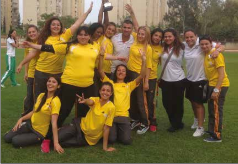
Atletizm takımımız kupaları ile