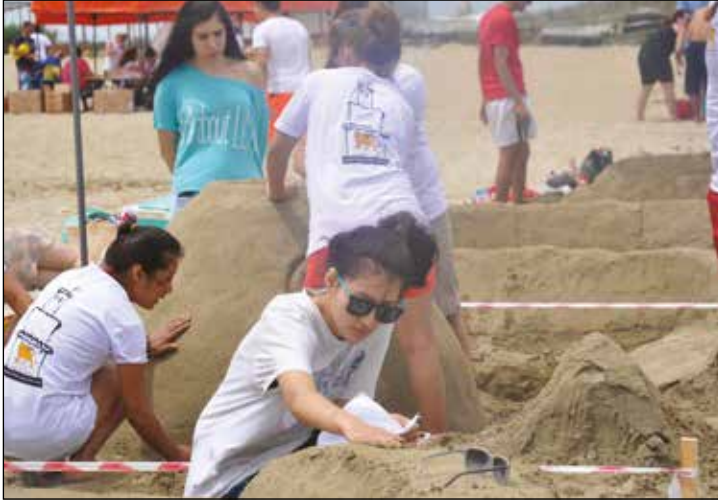
Kumdan Heykel Festivali ve Yarışması'na her geçen yıl ilgi büyüyor

festival geçtiğimiz yıllarda olduğu gibi Gazimağusa kentinin eşsiz güzellikteki kumsallarına, farklı bir heyecan, farklı bir coşku getirmiştir. DJ performansları ve barbekü partisi devam ederken, farklı ülkelerden katılan yarışmacılar, kumdan heykel yapmanın yanında, festivalde gün boyu sahilde doyuya eğlenmiş, kendilerine has danslarıyla da renkli ve eğlenceli unutulmaz bir gün yaşamışlar ve yaşatmışlardır.