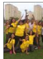
Atletizm Bayan Takımımız Türkiye 2. si