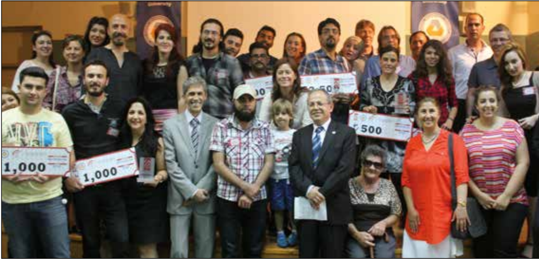
Festivalde ödül alanlar birarada

DAÜ İletişim Fakültesi tarafından bu yıl ilki düzenlenen festival, Nurşen Bakır tarafından verilen Deneysel Sinema atölye çalışması ile sona erdi.