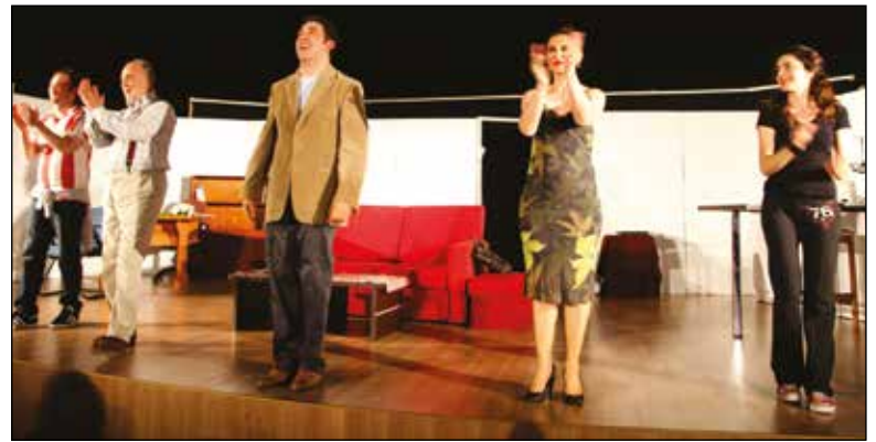
"Aşk Heryerde" oyunundan bir sahne