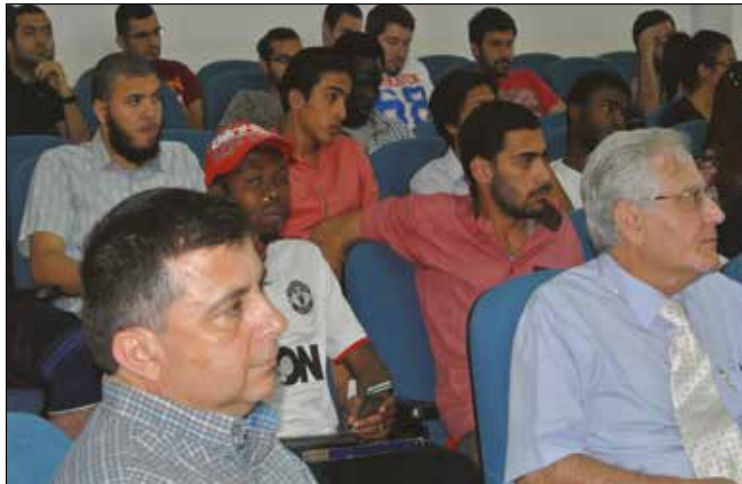
İnşaat Mühendisliği Haftası'na yoğun bir katılım oldu