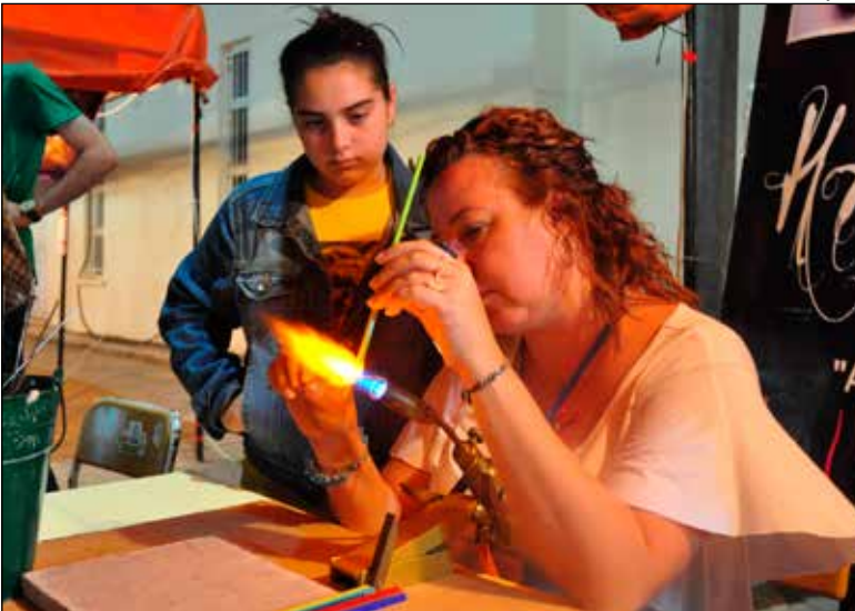
Standlarda cam aksesuar yapımı ilgi çekti