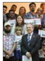
Fone Film Festivali'nde Ödül Heyecanı