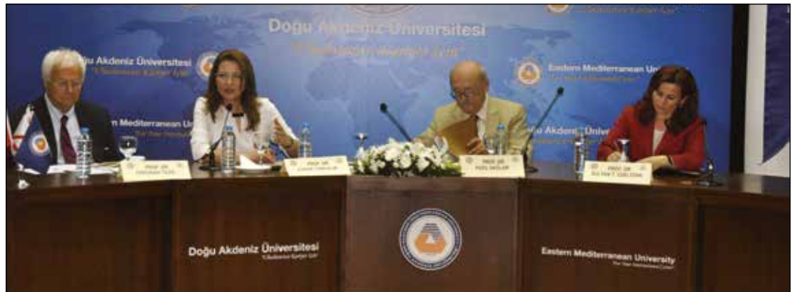
Sempozyumda Türkiye'nin Anayasası uzman hukukçular tarafından tartışıldı