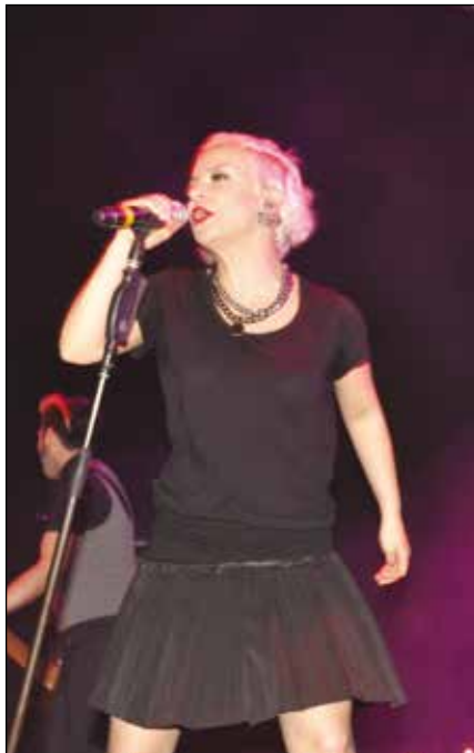
Model gençleri coşturdu