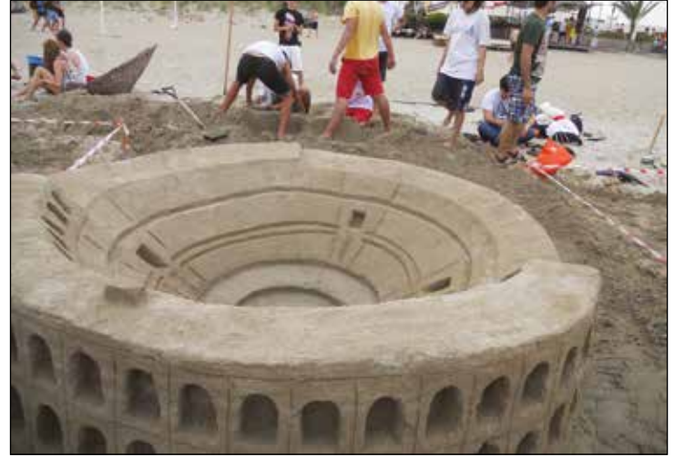
Kumdan Heykel Festivali ve Yarışması'na ödül kazanan çalışmalardan bir tanesi