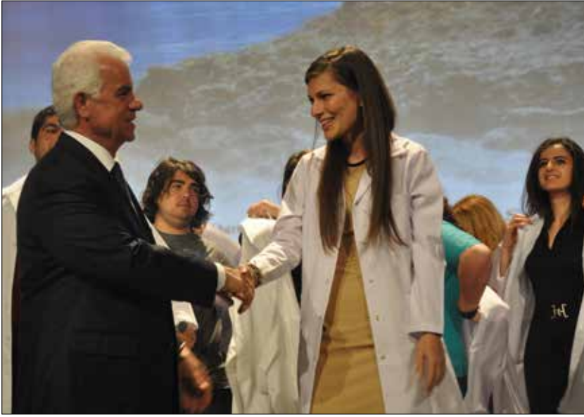
Cumhurbaşkanı Dr. Derviş Eroğlu Öğrencilere Beyaz Önlük giydiriyor

Söz konusu törende 700'ü aşkın yeni kayıt yaptıran Sağlık Bilimleri Fakültesi öğrencisine mesleğe ilk adımın işareti olarak beyaz önlük giydirildi. Ayrıca Voleybol müsabakalarında başarılı olan Sağlık Bilimleri Fakültesi, Spor Bilimleri Bölümü öğrencilerine de başarı belgesi ile Sağlık Bilimleri Fakültesi'nin başarılı öğrencilerine şeref ve yüksek şeref sertifikaları da takdim edildi.