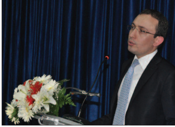
AKP İstanbul Milletvekili Mehmet Muş

2005 yılında DAÜ İşletme ve Ekonomi Fakültesi'nden fakülte birincisi olarak mezun olan Muş, yıllar sonra tekrar aynı fakültede bulunmaktan duyduğu gururu dile getirirken, mezun adaylarına kendi deneyimlerinden örnekler vererek kariyer planlamaları ve mezuniyet sonrası karşılaşılabilecekleri zorluklar hakkında bilgilerini paylaştı.