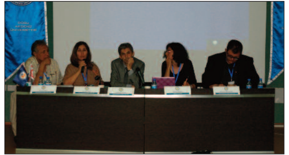
Panelistler Barış ve Çatışma'yı anlattı