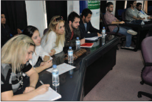
Uluslararası İlişkiler Bölümü öğrencileri konferansa yoğun ilgi gösterdi.

Konferansın son kısmında Avusturalya'nın Kadınları ve Kadın Haklarına verdiği önemi, ülkenin Kadın Hakları için uluslararası alanda yaptığı geniş çaplı yardım ve hizmetlerin olduğunu yineleyen Peacock, konuşmasını Türkçe olarak "Kadınlar gününüzü kutlu olsun, teşekkür ederim." cümlesi ile bitirdi. Konferansın ardından son olarak Peacock dinleyiciler tarafından kendisine yöneltilen soruları cevapladı.