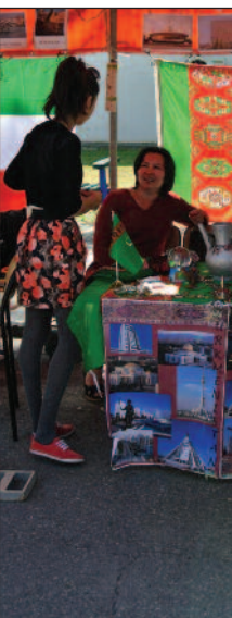
Kurulan standlarda değişik kültürleri tanıtmaya çalıştılar.

Çevre Günü gerçekleştirildi. Turizm Fakültesi bünyesindeki Turizm günlerine sektör temsilcileriyle birlikte katıldı.