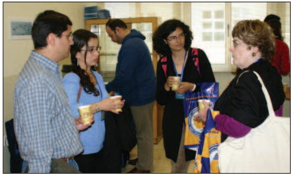
Konferans katılımcılarını bilgi alışverişinde bulundular