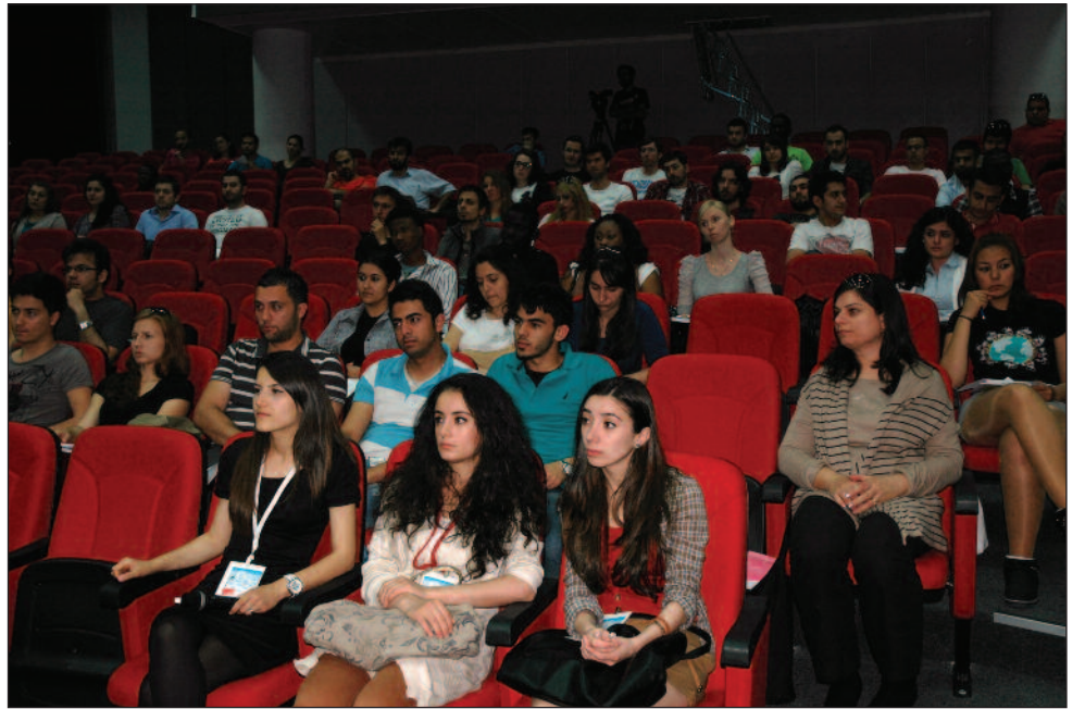
Öğrenciler Kariyer Günleri'nde iş dünyasının temsilcileri ile buluştu

Eğitim sektöründen iletişime, eczacılıktan bankacılığa, turizmden siyasete kadar pek çok farklı sektörden Müdür, İnsan Kaynakları Şefi ve Yöneticinin katıldığı Kariyer Günleri oturumları DAÜ Prof. Dr. Mehmet Tahiroğlu Salonu, Mustafa Afşin Ersoy Salonu ve Turizm Fakültesi TH108 numaralı salonda gerçekleştirildi.