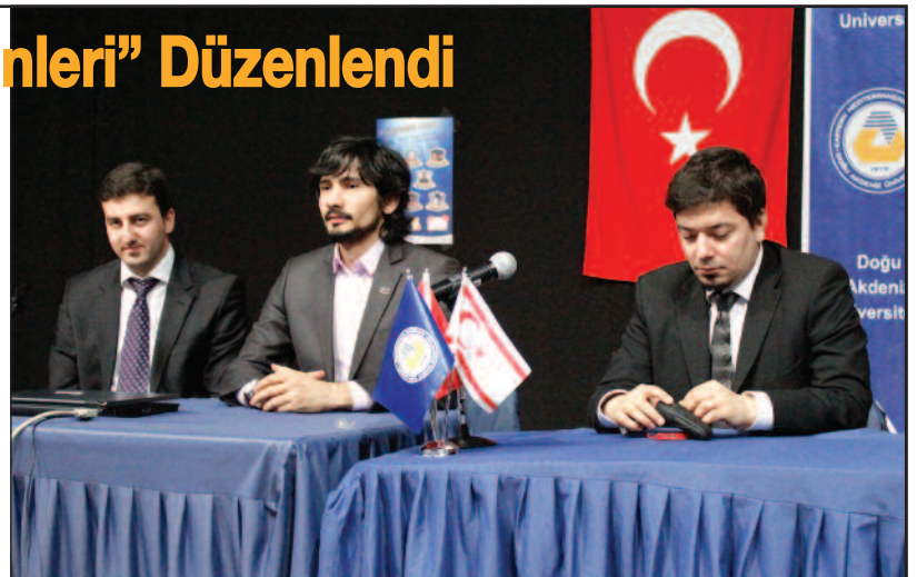
IEEE Kulübü genç girişimcilerle buluştu

İş dünyasını ve genç iş adamlarını DAÜ öğrencilerine tanıtmak ve özellikle öğrencileri girişimci, yenilikçi ve inovatif düşünmeye açık hale getirip girişimcilğe özendirme gibi başlıca hedefleri olan etkinlikte bu yıl "İnovasyon ve Girişimcilik", "Kariyer, Yaratıcılık", "Y Kuşağı, Satış, Perakendecilik, Takım Ruhu, Kişisel Gelişim Motivasyonu ve Stres Yönetimi", "Rekabet - Yoğun Bir Sektörde Start-Up", "Genç Girişimci Başarı Adımları" gibi konular işlendi.