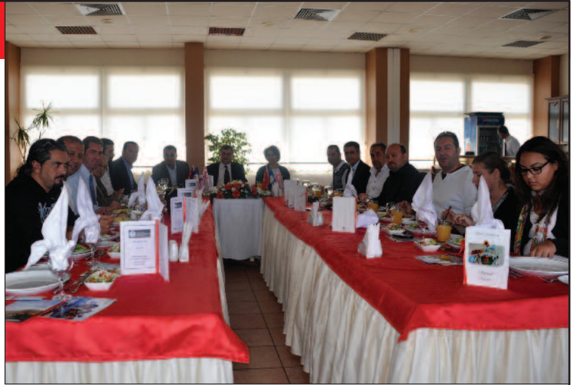
DAÜ Yönetimi ve Spor Yazarları Tower Bar'da biraraya geldi