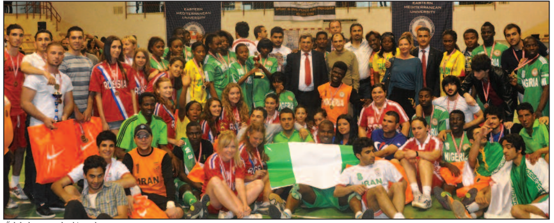
Ödül alan sporcular birarada