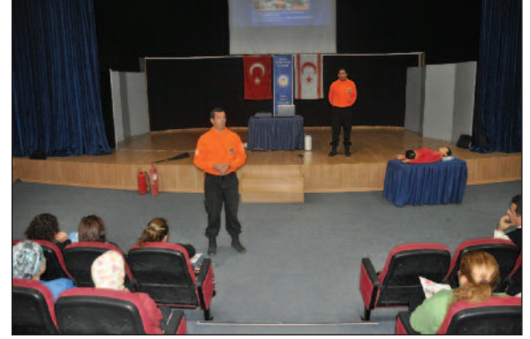
Sivil Savunma Personeli deprem, yangın ve ilk yardım konusunda bilgilendirildi

olaylar birebir gerçeğe uygun olarak düzenlenirken binanın tahliyesinden, arama kurtarmaya, yangının söndürülmesinden yaralılara yapılacak fiziksel ve psikolojik müdahaleye kadar herşey gerçeğe uygun olarak gerçekleştirildi.