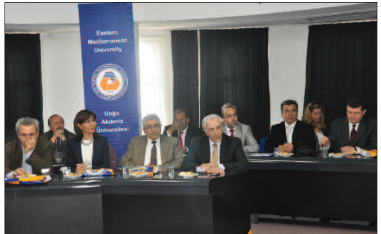
Toplantıya Gazi Üniversitesi Senato üyeleri katıldı

nato toplantılarını DAÜ'de gerçekleştirirken mutlu olduklarını dile getirerek DAÜ yönetimine teşekkürlerini iletti.