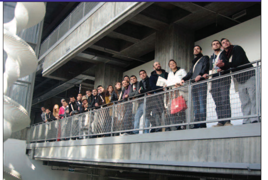
İç Mimarlık öğrencileri Teknik Gezi sırasında bilgilendirildiler