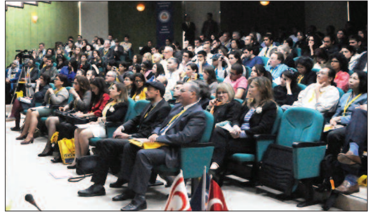
ISVS-6 Konferansı'na yoğun katılım oldu.

Mimarlığın en esas konularından ve günümüzün en temel sorunlarından biri olan konut, yerel değerler ve yerel mimarlık üzerinde gerçekleştirilmiş olan ISVS-6, konusunda uzman birçok akademisyen ve araştırmacıyı bir araya getirerek, bu alandaki ev-