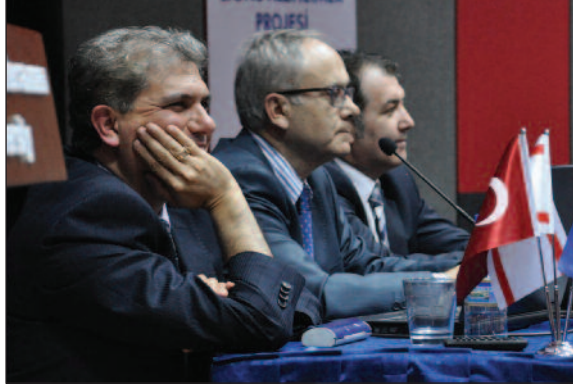
Ünlü profesörler alzheimeri anlattı

sorununa karşı dikkat çekmek ve farkındalık yaratma hedefinde olduklarını vurguladı.