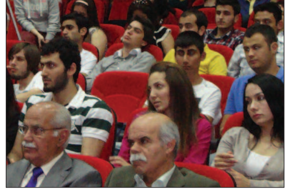
Katılımcılar alzheimer konusunda bilgilendirildiler