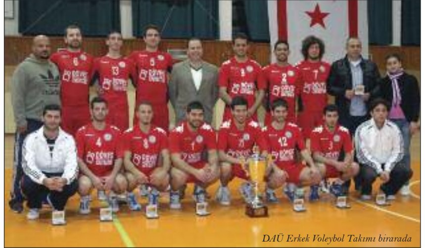
DAÜ Erkek Voleybol Takımı birarada