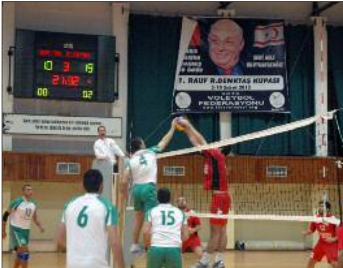
Sporcularımız tüm maçlarda üstün bir oyun sergiledi