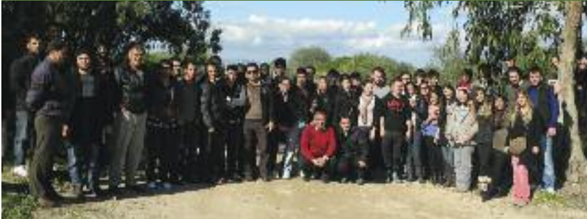
DAÜ'liler diktikleri fidanlarla Kıbrıs'ın doğasına katkıda bulundular

Doğu Akdeniz Üniversitesi (DAÜ) öğrencileri ve öğretim elemanları Matematik Kulübü organizasyonluğunda, Bedis bölgesine fidan diktiler. Kıbrıs'taki orman sayısının azlığına dikkat çeken öğrenciler; insanların ağaçları bilinçsizce kesmelerinden duydukları rahatsızlıklarını dile getirdiler. Rahmetli Kurucu Cumhurbaşkanımızın vefatından duydukları üzüntüyü de dile getiren