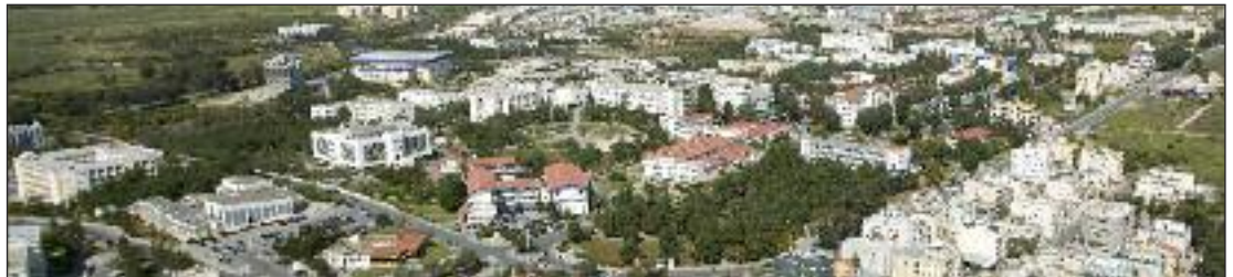
DAÜ, 3 bin dönümlük kampüsü ile de dikkat çekiyor

gösteren 180'i aşkın Devlet ve Vakıf Üniversiteleri arasında ise Tıp Fakültesi olmayan üniversiteler içerisinde 7., ücretli eğitim veren üniversiteler arasında ise 5. sırada yer almıştır. Bu başarı, üniversitemizi gururlandırması yanında, hedeflenen kaliteli eğitim ve uluslararası kariyer vizyonu ile önümüzdeki yıllarda daha iyi sıralarda yer alması açısından motive etmektedir.