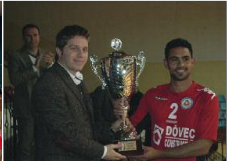
Sporcularımız kupayı Merhum Kurucu Cumhurbaşkanı Rauf Raif Denktaş'ın torunundan aldılar