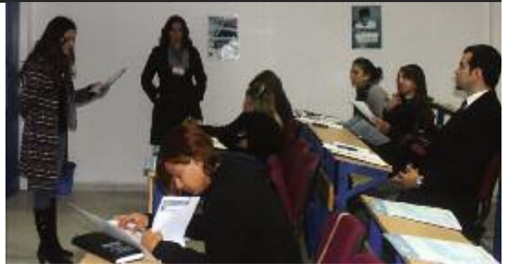
TOLES tanıtım günlerine katılan katılımcılar, Hukuk İngilizcesi derslerini izleme fırsatı yakaladılar

TOLES kursları ile ilgilenenler DAÜ Sürekli Eğitim Merkezi'nden veya http://sem.emu.edu.tr adresinden de temin edebilecekleri başvuru formlarını DAÜ-SEM sekreterliğine teslim ederek veya fakslayarak (Fax no: 03926302472) kurslara kayıt yaptırabilirler. İlgile-