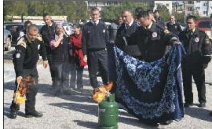
Yangın söndürme tatbikatı ilgi ile izlendi

341'inin ihmalen kaynaklandığını belirtti. Soru cevap şeklinde geçen Gürpınar'ın yaptığı sunumun ardından, İtfaiye Başmüfettişi Aktivite Merkezi park alanında yangın söndürme tatbikatı gerçekleştirildi.