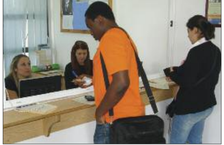
Öğrenciler, Öğrenci Hizmetleri Ofisi'nde işlem yaptırırken

DAÜ Öğrenci Hizmetleri Ofisi ile ogrencihizmetleri@emu.edu.tr veya