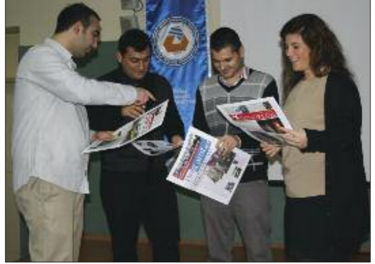
Öğrenciler hazırladıkları gazeteleri, gazete yöneticilerine sundular