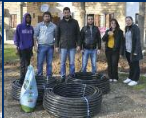
SOS Çocuk Köyü bahçesi iletişim öğrencileri sayesinde artık daha düzenli