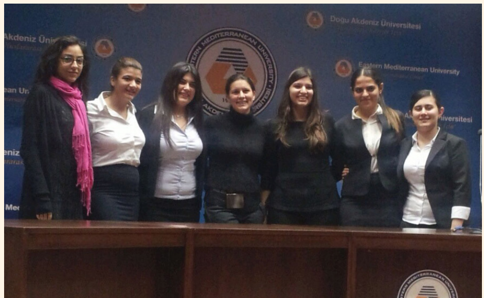
"Beyaz Perde Günleri"ni düzenleyen ekip birarada