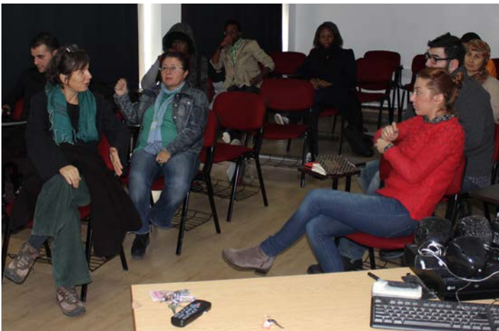
Atölye çalışmasında öğrenciler

DeneySEL ve belgesel filmler yapan Nurşen Bakır, 1979-1981 yılları arasında devam ettiği Hacettepe Üniversitesi Felsefe bölümündeki eğitimini yarım bırakarak, sinema alanında öğrenim görmek için ABD'ye gitti. 1991'de City University of New York'ta lisans, 2002'de San Francisco State University'de yüksek lisans eğitimini tamamladı. Çok sayıda belgesel çekti. Amerikalı ve Hollandalı sinemacılarla çalıştı. Bilgi Üniversitesi Film ve Televizyon Bölümü'nde öğretim görevlisi olarak çalıştı. Halen, Sine-Yol bünyesinde belgesel filmler çekmektedir.