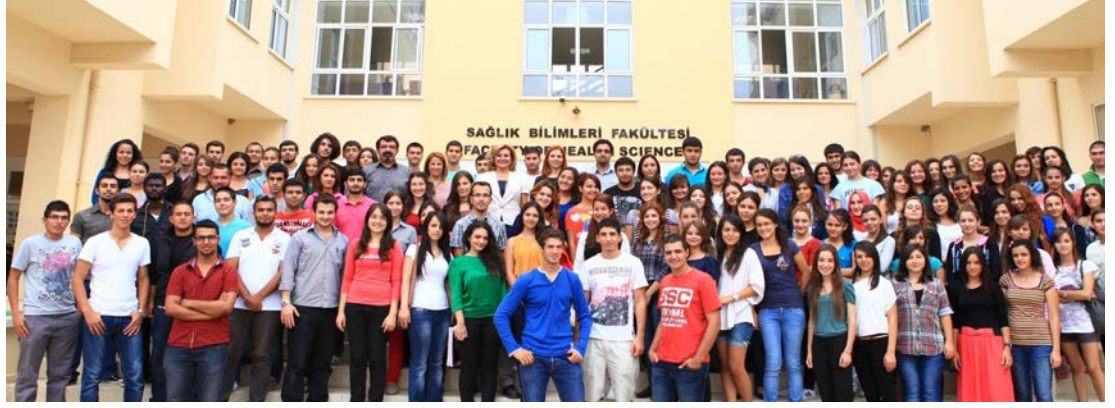
Sağlık Bilimleri Fakültesi öğrencileri birarada