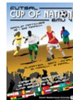
"V. Uluslararası Futbol Turnuvası" Başladı