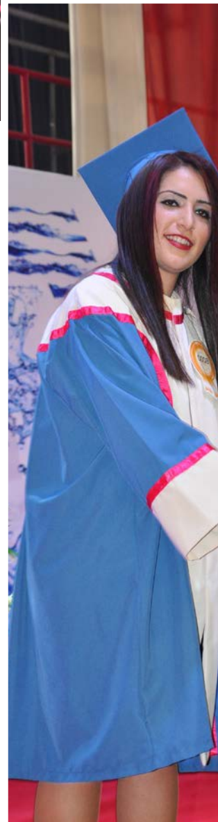
Mezunlarımız adına sembolik ağaç dikme töreni