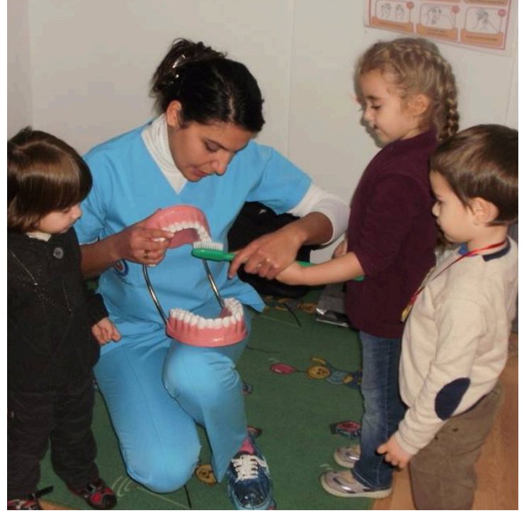
Minikler el yıkama ve diş fırçalama yöntemlerini öğrendiler

ları arasında yer alan ağız-diş sağlığı problemleri göz önünde bulundurularak çocuklara diş fırçalamaya yönelik bilgilerin anlatıldığı etkinlikte, hemşirelik bölümü öğretim görevlileri ve öğrencileri miniklere eğitimlere yönelik uygulamalar da yaptırdı. DAÜ Sağlık Bilimleri Fakültesi Hemşirelik Bölümü öğretim görevlileri ve öğrencileri, sağlıkla ilgili alışkanlıkların küçük yaştan itibaren kazanıldığını belirterek yapılan söz konusu etkinliğin kalıcılığa dönüşmesinin son derece önemli olduğunu vurguladı.