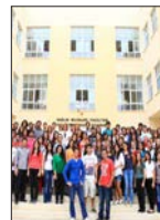
Sağlık Bilimleri Fakültesi Bir İlke Daha İmza Atıyor