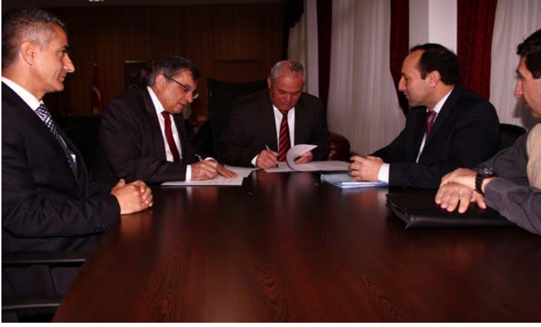
Protokol İmza Töreni'nden bir kare