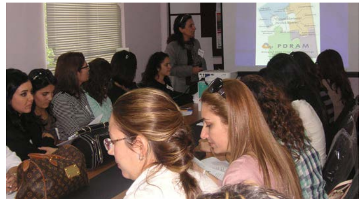
Anaokulu eğitimcileri DAÜ-PDRAM'ın atölye çalışmasına yoğun ilgi gösterdi