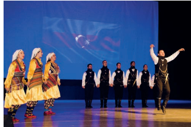
Öğrenciler çeşitli dans gösterileri gerçekleştirirken