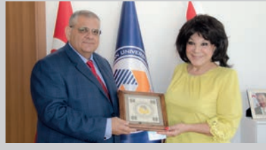
DAÜ'de "Dünya Azerbaycanlılar Dayanışma Günü" Kutlandı