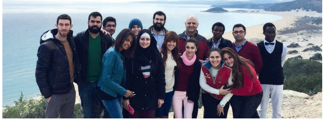
Toplantı sonrası Karpaz gezisi düzenlendi

Çalışmayı takip eden günde de DAÜ Genetik Kulübü Karpaz gezisi etkinliği düzenleyip özellikle yabancı uyruklu DAÜ Genetik Kulübü üyelerine KKTC'yi tanıtmak adına sosyal anlamda bir etkinlik daha gerçekleştirdi.