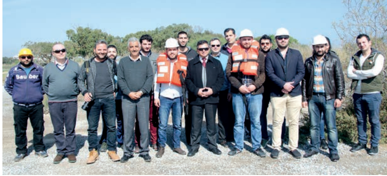
Beton kanoyu yapan öğrenciler ve İnşaat Mühendisliği Bölümü ekibi birarada