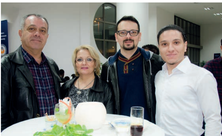
Resepsiyona katılan öğrenci aileleri