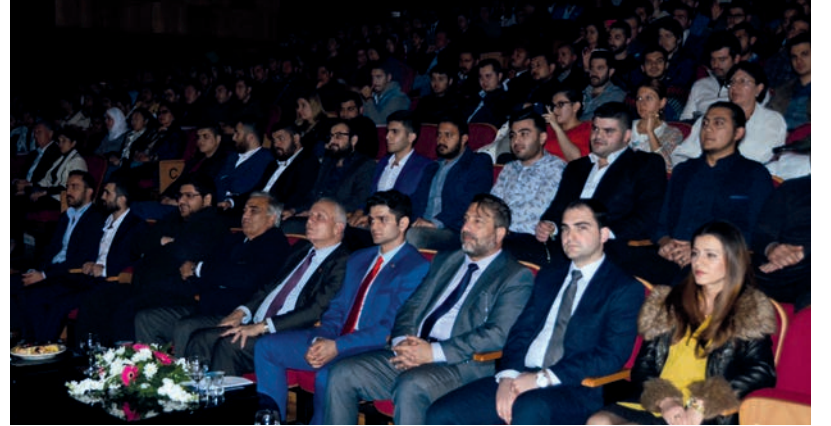
Etkinliğe DAÜ yönetimi ve öğrencileri büyük ilgi gösterdi