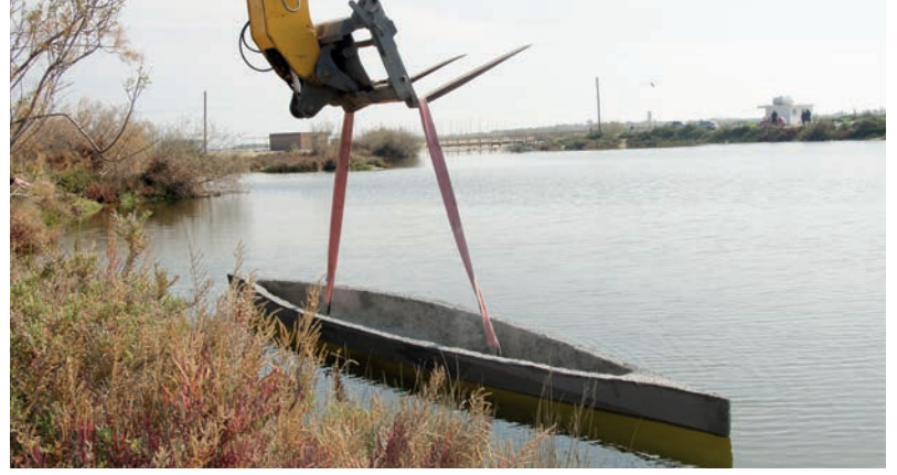
Beton kano suya indirilirken