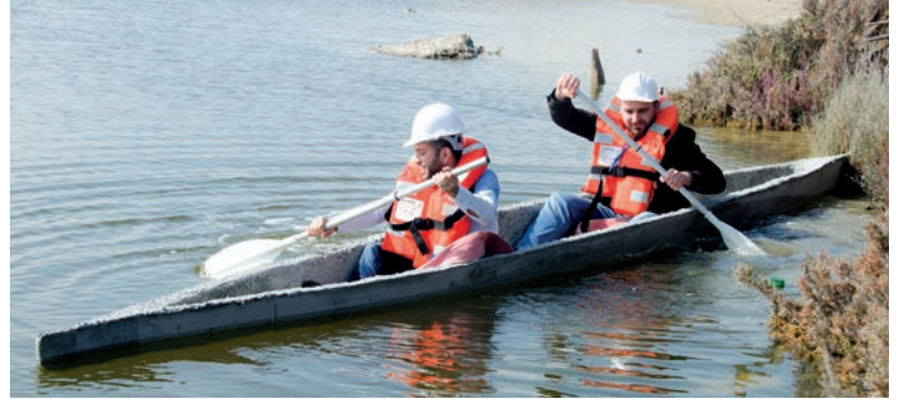
Öğrenciler beton kanoyu suda yüzdürmeyi başardı