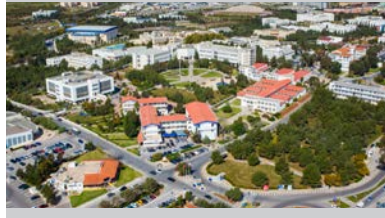
DAÜ'lü Akademisyenlerin Uluslararası Başarısı Devam Ediyor