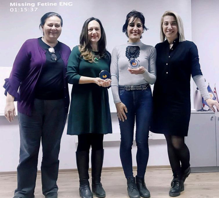
Missing Fetine ENG 01:15:37